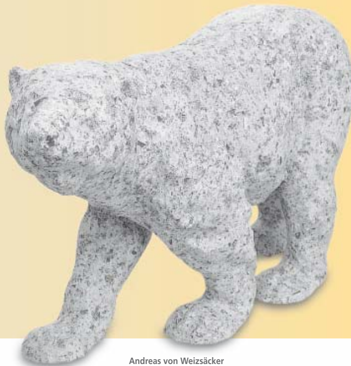
Andreas von Weizsäcker Bär

Vereinbarungen können aber auch stillschweigend geschlossen worden sein, z. B. wenn Bezug auf einen Katalog oder sonstige Beschreibungen des Bildes genommen wird. Wer ein Gemälde „in der Art“ oder „im Stil von Picasso“ kauft, darf kein eigenhändiges Werk erwarten.